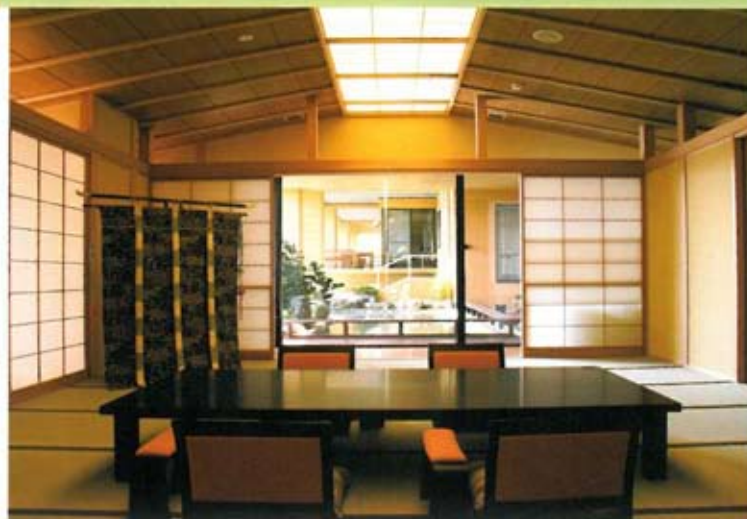
水鏡庵小宴会場「水鏡の間」