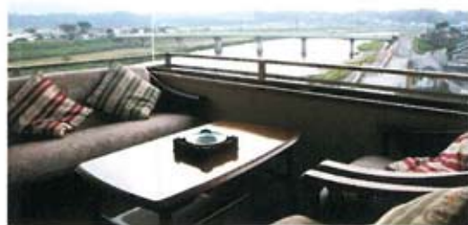
パノラマで菊池川の景色を楽しむ特別室