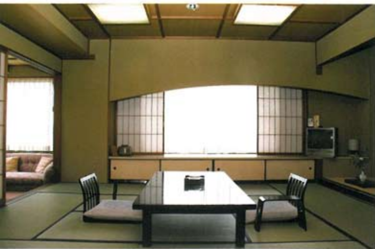
菊池川を眺めるお部屋