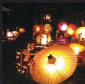
山鹿灯籠浪漫百華百彩