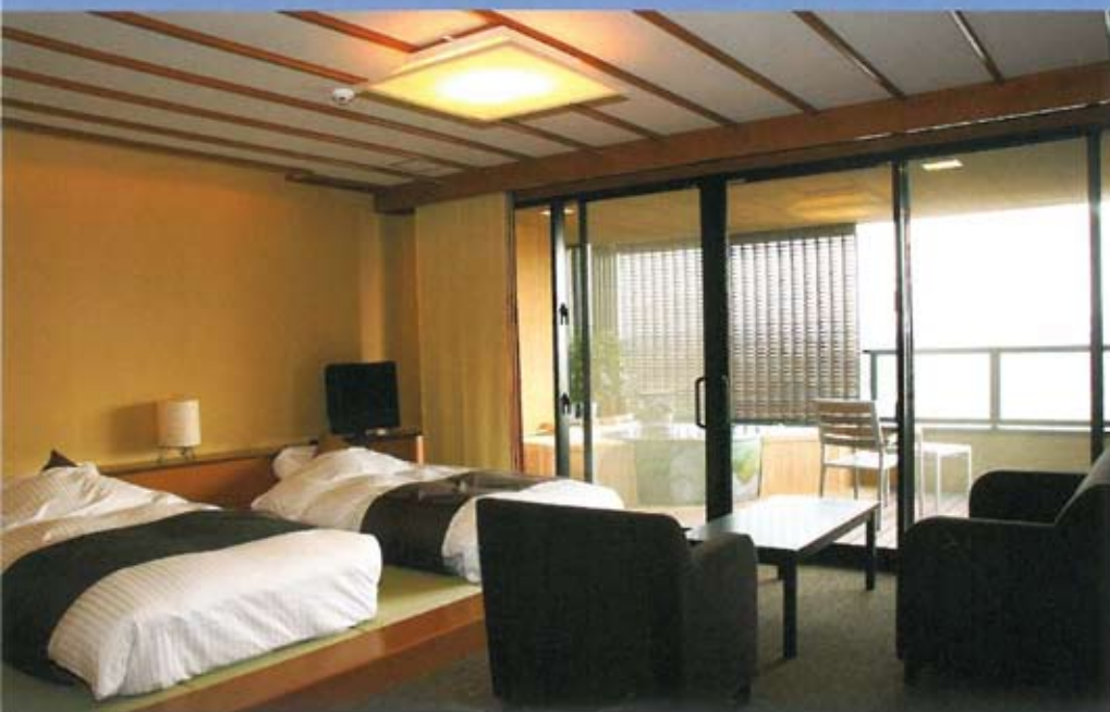
明るくのびやかな空間。I-type(和洋室)のお部屋