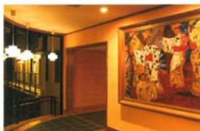
旬彩きよたき 入口