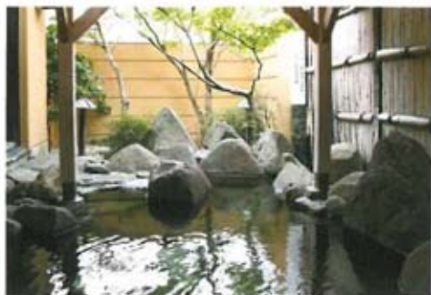
「もみじの湯」露天風呂

「山鹿千軒たらいなし…」と言われるほど豊富な湯量を誇る山鹿温泉の湯は、知らず知らずのうちに長湯をしてしまうほどまるやかで柔らかな肌触りが特徴です。ゆったりと旅の疲れを癒していただけます。