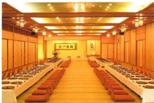
鹿門亭大広間「肥後六花」