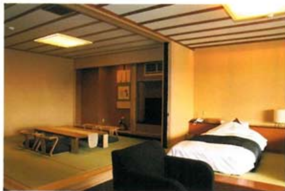
落ち着いた佇まいの和室