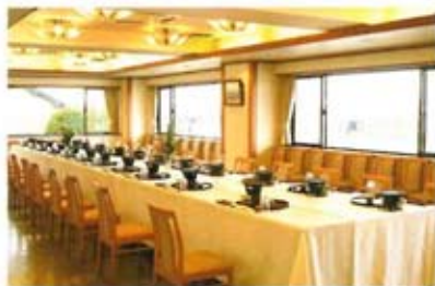
多目的ホール「花木木の間」