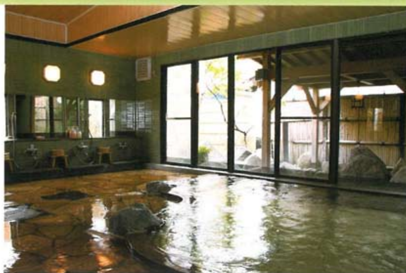
大浴場「もみじの湯」