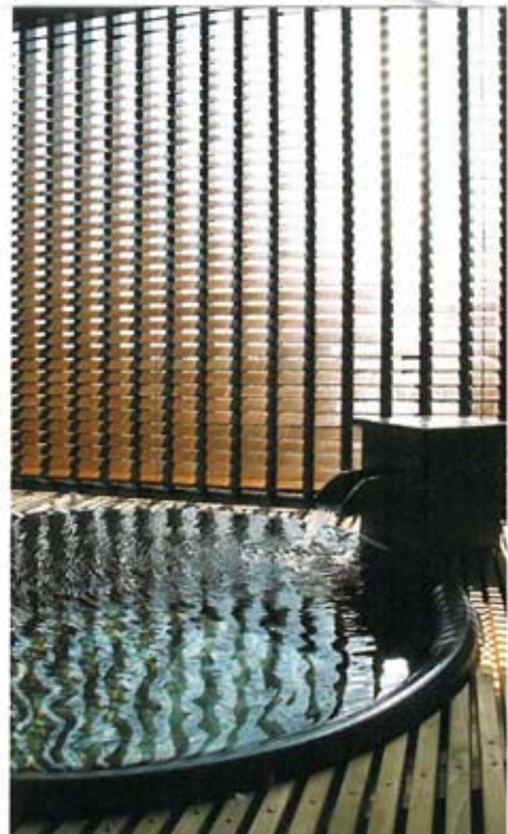
陽射しがふりそそぐ露天風呂